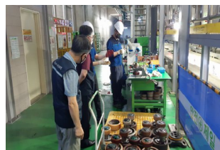
〈서틀트레인 작업 현장〉