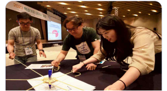
▲ 핵심가치 내재화 교육 활동 모습

지금까지 진행된 교육 과정의 전반적인 만족도는 4.6점(5.0점 만점)이었으며, 교육생들은 이번 교육을 통해 다양한 분야의 직원들이 함께 모여 유대감을 형성하고 동료의식을 느끼는데 도움이 됐다고 말했습니다.