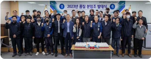
▲ 2023년 품질 분임조 발대식 기념촬영 모습

분임조 활동은 유·무형의 문제점을 발굴하고 이를 해결하여 공항 시설관리 품질을 향상시키는 활동입니다. 이번 활동에 참여한 20개 분임조는 4월부터 11월까지 활동을 진행할 예정이며, 「분임조 결성 및 주제 선정→활동계획 수립→현상 파악→원인 분석→목표 설정→대책수립 및 실시→효과 파악→표준화→사후 관리→반성 및 향후계획」 총 10단계의 프로세스에 따라 분임조 활동을 시행할 예정입니다. 분임조 활동을 통해 사내 개선활동 강화 및 혁신문화가 정착되기를 기대합니다!