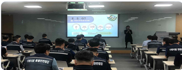
▲ ESG 인식확산 교육 모습

※ ESG 경영이란 기업의 지속가능한 성장을 위해 기존의 재무적 요소 외에 비재무적 요인인 환경(Environmental), 사회(Social), 지배구조(Governance)를 고려해 기업을 운영하는 것을 뜻함.